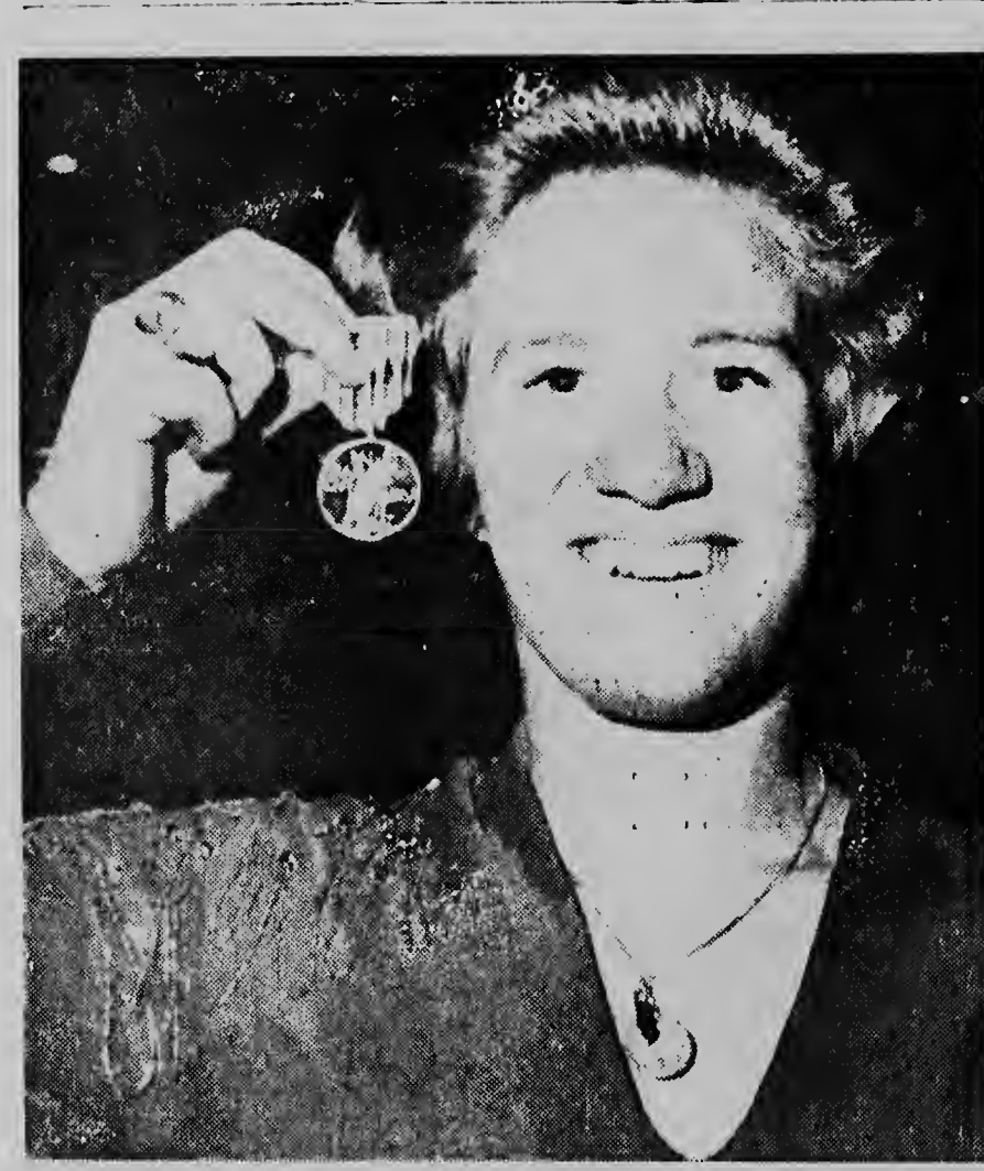
Sjoukje Dijkstra, orgullosamente ta muestra su medalla despues cu el a bolbe bira campeona mundial di schaats na Budapest.

134 asiento di e Camara nobo di Diputados lo word'e eligi directament'e mientras ku e 54 asiento nan sabra lo word'e repartí entre e partidonan ku ta participa, basta si nan tin e mínimo di cinco porciento di e votonan.